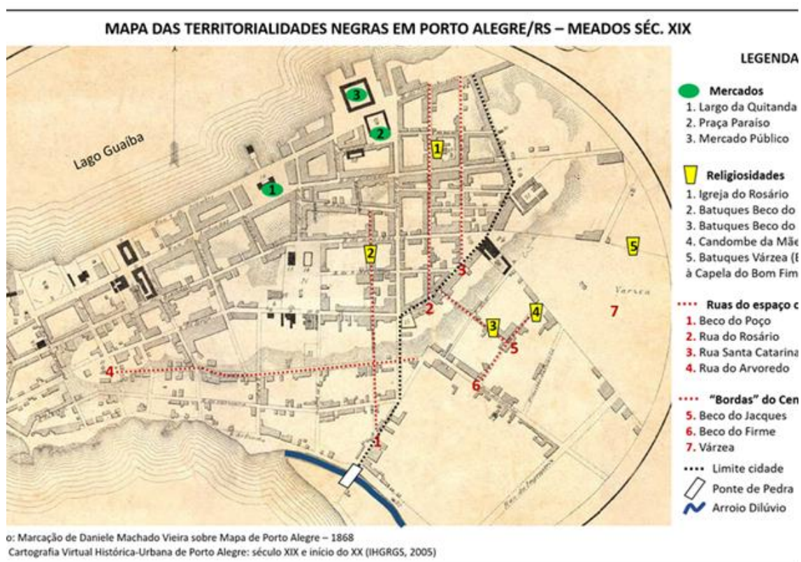
Figura 3: Mapa das Territorialidades Negras em Porto Alegre/RS – Século XIX